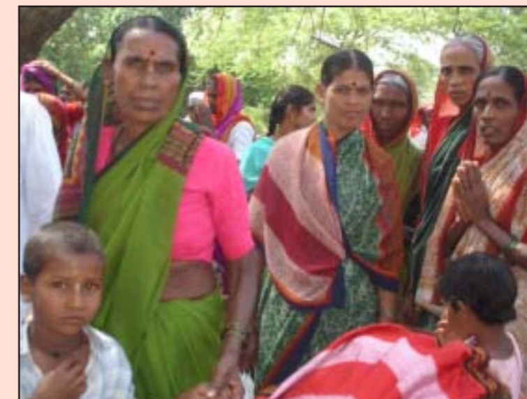
Vi ska få vår rätt till mat

Svår fattigdom leder ofta till att föräldrar tvingas skicka sina barn för att arbeta så att de också bidrar till familjeförsörjningen, istället för att gå i skolan. ActionAid har arbetat för att dessa barn ska få den undervisning de har rätt till. Vi har särskilt jobbat för att flickor ska få gå i skolan. Deras utbildning ses ofta som mindre viktig jämfört med pojkars. Följande har gjorts: