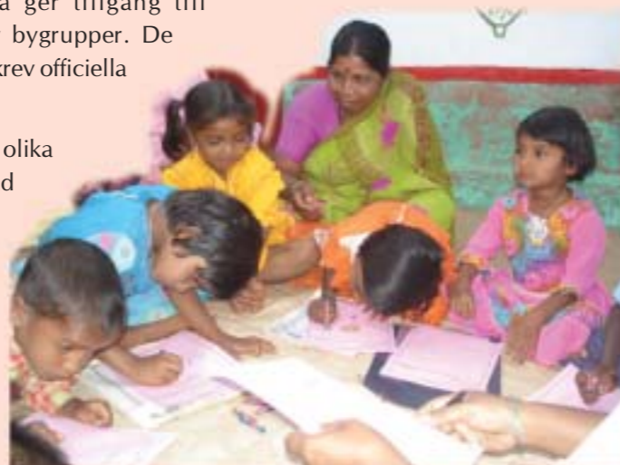
Vi tycker om att rita och måla