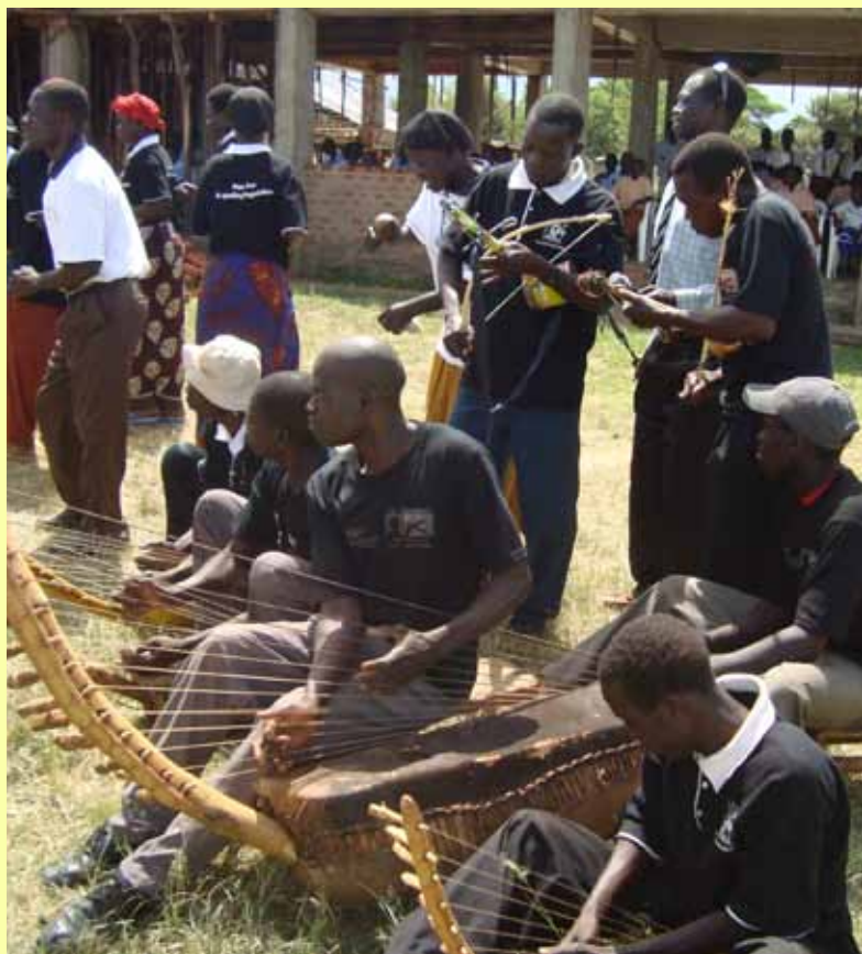
Traditionella instrument i Nebbi.

”Bara i Nebbi finns det tio teatergrupper, sex kulturgrupper och över tio musikgrupper. Vi har sammanlagt nio traditionella danser och många traditionella sånger. När vi samarbetar med ActionAid väljer vi först ett ämne som vi vill diskutera. Sedan skriver vi särskilda sångtexter och koreograferar danser som handlar om det. Det är väldigt populärt och vi är mycket stolta över att vara en del av det viktiga arbetet.”