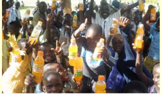
Barnens Dag är mycket uppskattad.