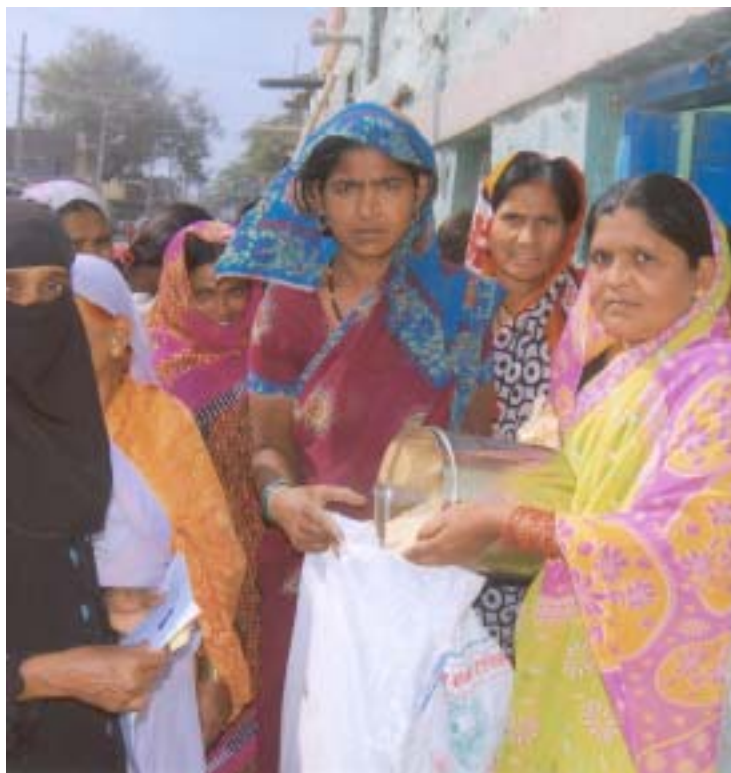
Under 2009 har 1 000 familjer fått tillgång till rabatterad mat så att de kan klara sig.

Med ditt stöd har ActionAid de senaste 12 månaderna kunnat genomföra bland annat följande: