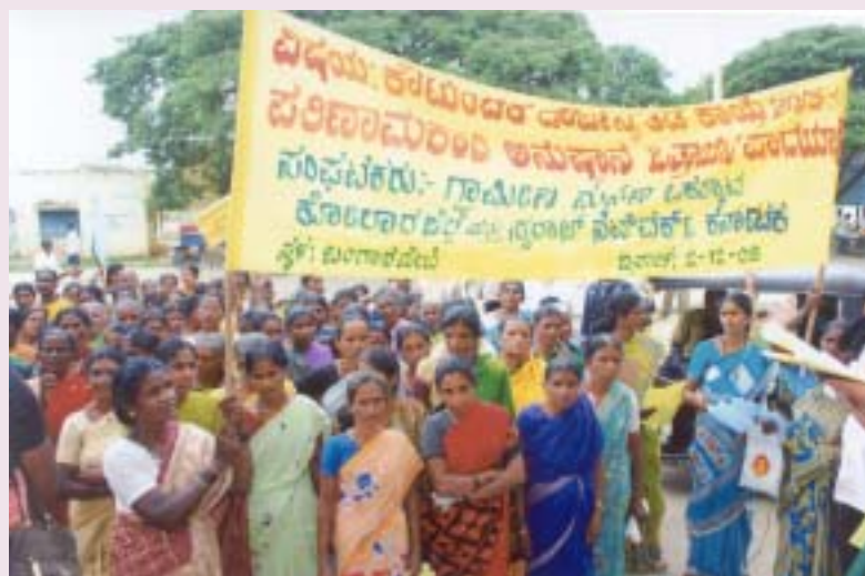
Kvinnor från 76 byar i fadderbarnsområdet har börjat organisera sig mot våld.